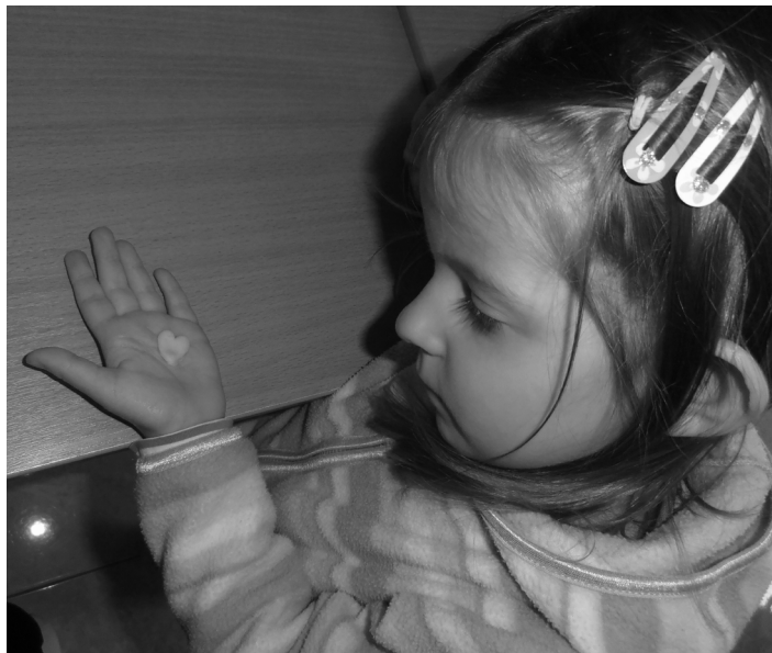
jesenné Tvorivé dielne