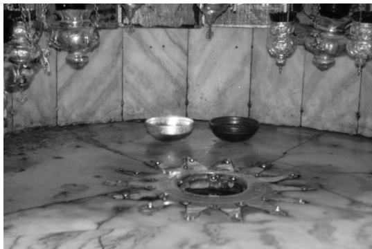
Hviezda označujúca miesto Ježišovho narodenia. Jej štrnásť cípov symbolizuje štrnásť generácií v rodokmeni Matúšovho evanjelia a rovnako poukazuje na štrnásť zastavení krížovej cesty.

spočinuli jeho nohy“; zanechala aj nasledujúcim pokoleniam plody svojej zbožnosti. Postavila Bohu, ktorého uctievala, dva chrámy – jeden pri jaskyni Narodenia Pána v Betleheme, druhý na Hore Nanebovstúpenia.“